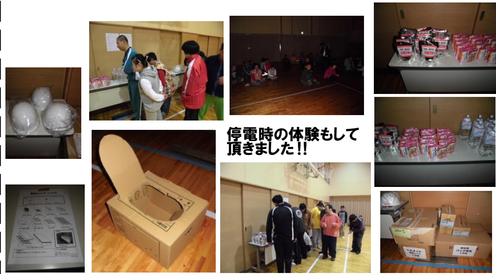
停電時の体験もして頂きました!!

11月28日(土)に八尾市立障害者総合福祉センターの4階多目的ホールにて災害時の過ごし方として、段ボールのベッドや簡易トイレなどを見ていただきました。また、災害用のグッズなども手に取って触っていただきました。このようなグッズ等を使用することが無い様に過ごしていける事を願っています。利用者の方には、非常食の白米粥を1袋ずつ持ち帰ってもらいました。一度、ご賞味いただければと思います。ご家庭でも、非常時の準備及び避難場所などの確認をして頂ければと思います。